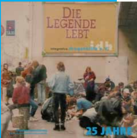
Die Legende lebt 25 Jahre idh Integrative Drogenhilfe e. V. Frankfurt am Main ©2011 Fachhochschulverlag ISBN 978-3-940087-87-4